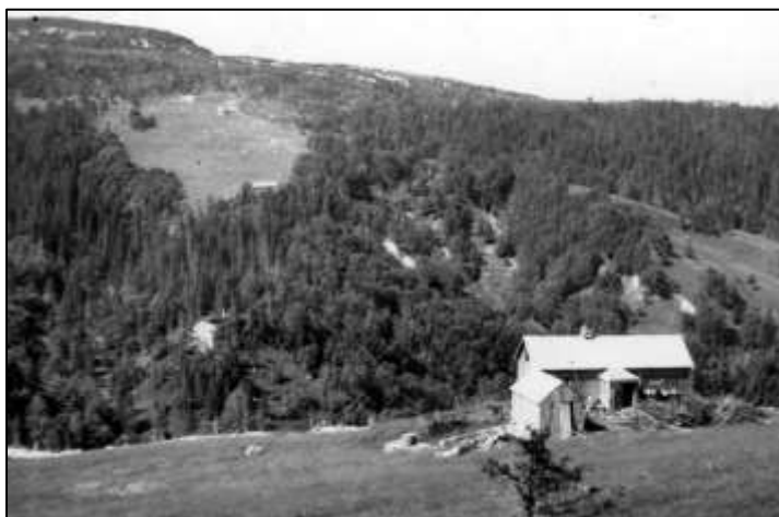
Nysetra mens den var i bruk, rett over dalen ligger Stampen

Seterhusa står fremdeles og husa med tomte er overdratt til Willy Turbekmo som er far til eier av Bjørkaunet.