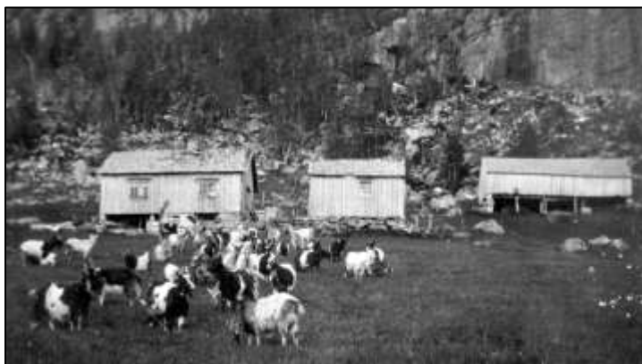
Gammelsetra i Bjørkaunet