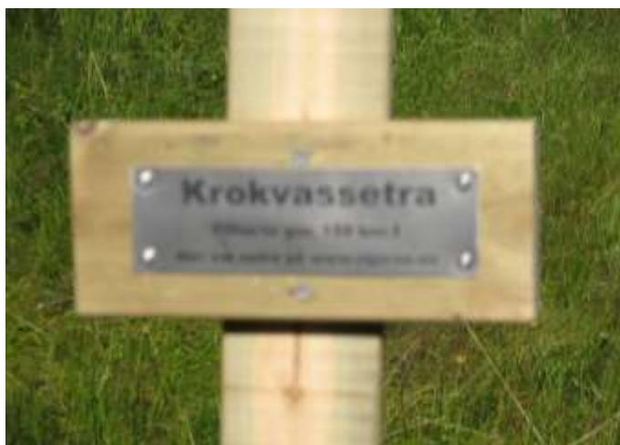
Seterplassen er merket med en slik stolpe

Setra tilhørte Rødsjø 159/1 som også hadde seter i Mefjellslia på den tiden. Nå var det flere plassboere i Rødsjøen på den tiden så det kan være at noen av dem også hadde interesse av seterdrift. I tillegg til egne geiter var det vanlig med «leiegeiter» fra folk i Råkvåg og øyene.