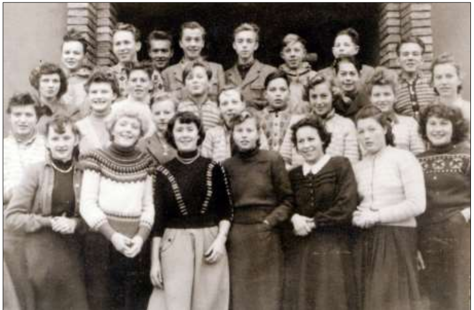
Stjørna framhaldsskole i 1956

fast som et påbyggingsår for dem som var ferdig med 7 år på barneskolen, men først etter at Mælan skole var utbygd ble den fast.