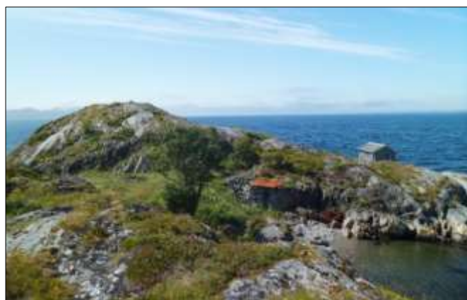
Vorpbua på Mikkolholmen og bunkeren i bergene nede ved sjøen. På det grønne området og mot venstre i klova som går over holmen, sto de gamle sjøbuene og røykbua, og der hadde tyskerne sine anlegg.