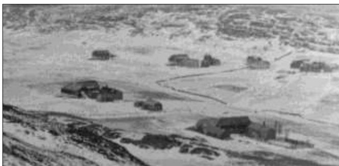
Grenda Selnes. Vi kan se den gamle skolen på Selnes mellom gårdene «Hagenmarka» og «Jensmarka».