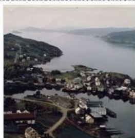
Gammeldaga i Råkvågen

I en billedsamling blir det lett mye personer, men mindre fra dagliglivet. Det finnes nesten ikke bilder fra kjøkken og matlaging. Få fram bilder fra arbeid og dagligliv. Stå på og kom med flere bilder!