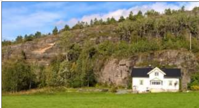
Her ser vi hvor steinraset gikk.

I den senere tid har det vært endel prating om at de kjente turistattraksjonene Prekestolen og Trolltunga hadde sprekker og kom til å falle ned omsider. Og ikke å forglemme Fjellmannen, som skulle falle ned for en tid tilbake. Men alle disse fjellpartiene står fortsatt på plass.