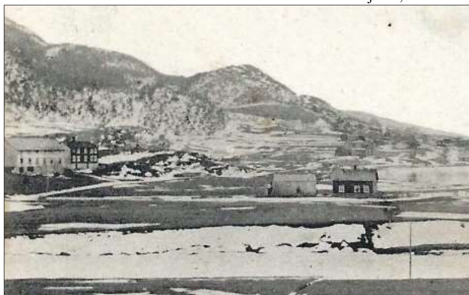
Bilde av skolen fra før 1900 (Utsnitt fra postkort)