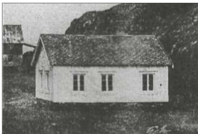
Skolen fra 1957.