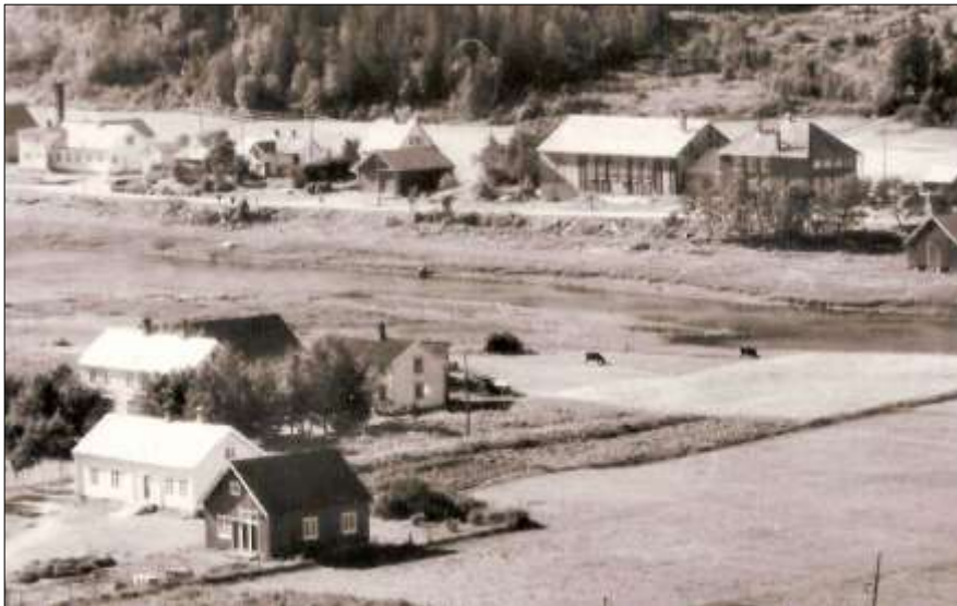
Gammelskolen på 1950-tallet, Gården Folkvang bak

Skolen på Mælan dekket helt fra starten bare Sørfjorden fra Kleiva til Bjørnsvika på grunn av manglende veiforbindelser. Elevtallet var 54 i 1874 og med 18 uker undervisning. Skoleåret var i vinterhalvåret.