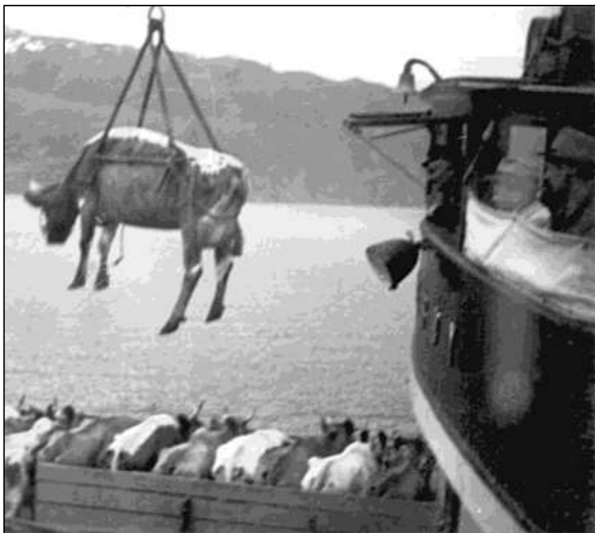
Illustrasjonsbilde som viser kutransport slik den skjedde på rutebåtene som gikk på Stjørnfjorden i gamle dager.

Antagelig ble resultatet et elendig oppgjør til selgeren enn om han hadde latt kjøper disponere kuskaltet etter avtalen.