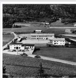
Gammeldaga i Sørfjorn