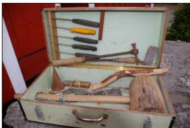
Petter slaktekasse med de nødvendige redskaper. Den er laget av broren Anker og tilpasset bagasjebrettet på sykkel