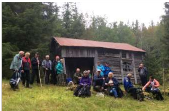
Deltakerne på turen samlet foran setra slik den er i dag