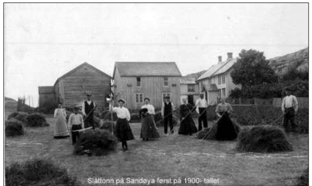
Fine såter og festklede folk på Sandøya på 1900-tallet

Ikke alle hadde låve eller høyløe like ved så da laga de høysåte eller høystakk. Det var vanlig å sette en staur godt i bakken og legge det tørre høyet lagvis rundt stauren slik at regnet rant av uten å skade høyet.