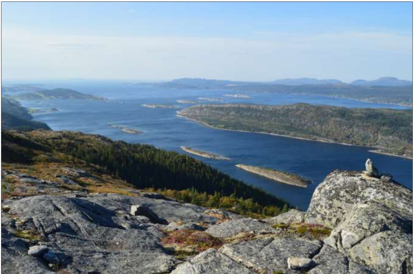
Øyriket – Stjørnfjorden med alle sine øyer