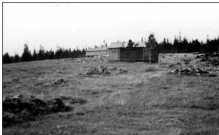
Setra slik den var da den var i drift i 1940-åra