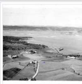
Gammeldaga på Selnes