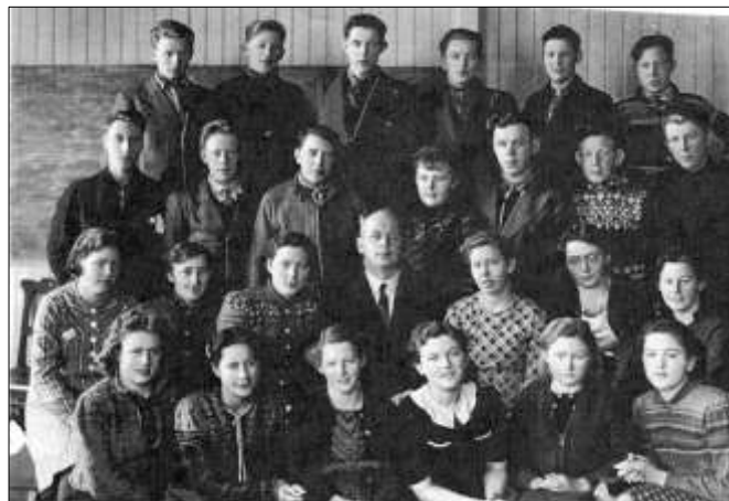
Framhaldsskole i Fevåg.

Eide hadde 54 og Råk 51. I 1937 var elevtallet i Fevåg 91 og hadde 4 klasser som var flest i Stjørna.