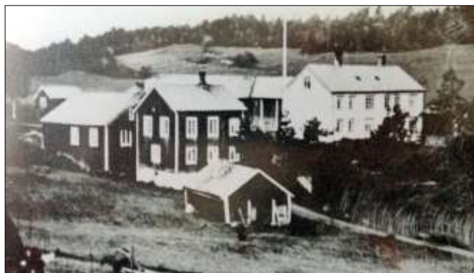
Varghiet gard med den gamle stuelåna med skole i 1870-1880

I karakterprotokollen for Bjugn Herred frå 1863 finn vi at den andre kretsen i herredet var Stallvik. Dei 34 elevane mellom 9 ½ og 15 år som fekk vurdert om dei hadde nådd måla hadde adresse Søtвика, Stallvika, Gjølja, Gjøljalja, Duskaret, og Varghiet.