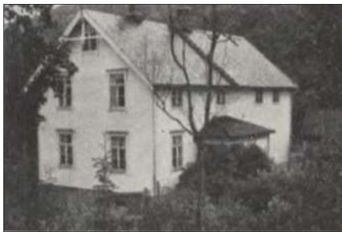
Eide skole 1955.

1965: «Det er vel siste året det undervises i Eide skole. Fra høsten skal barna overføres til Botngård skole. Eide skole hadde forresten 50 års jubileum 25.01.1965.»