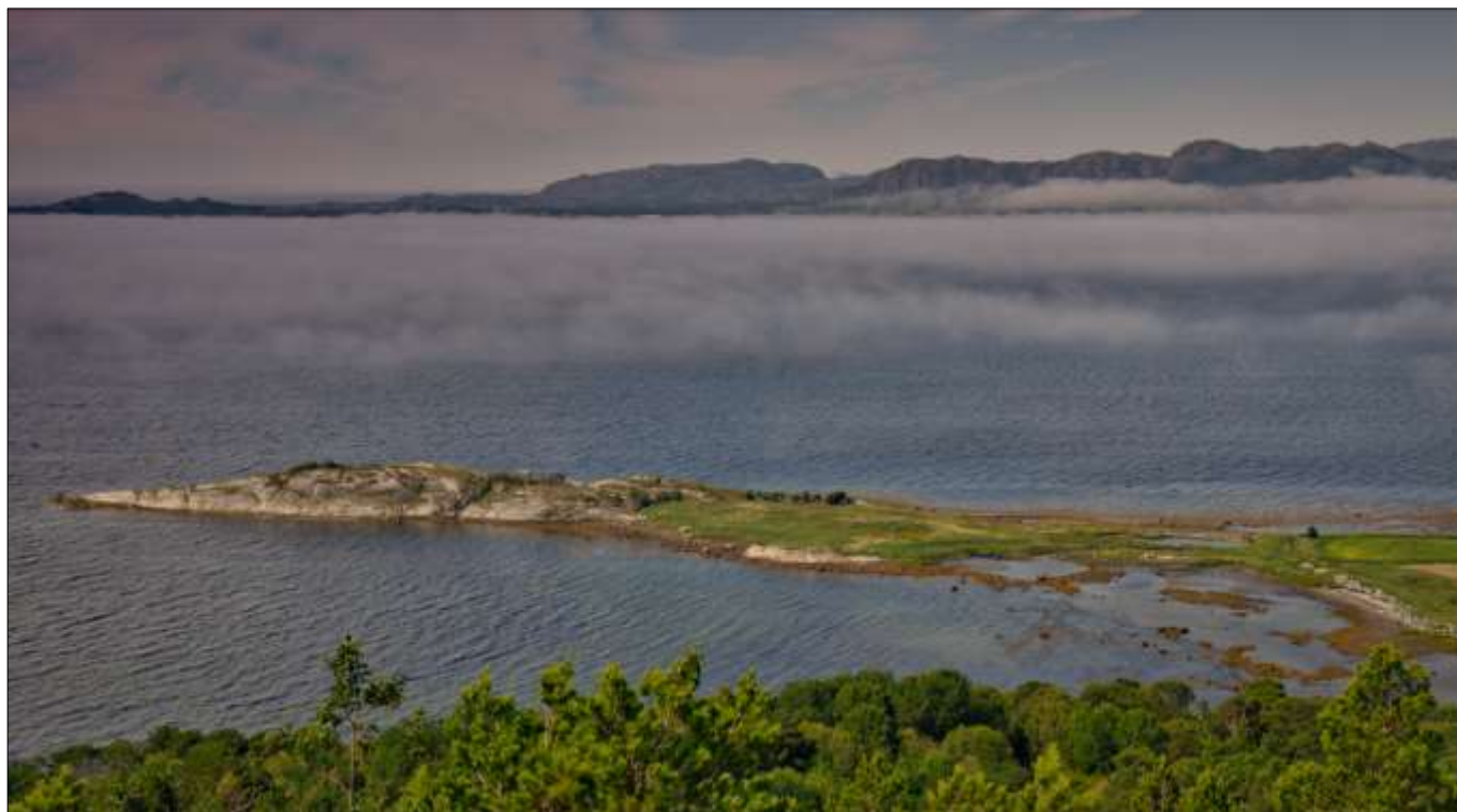
Mikkelholmen sett fra Brettingen.