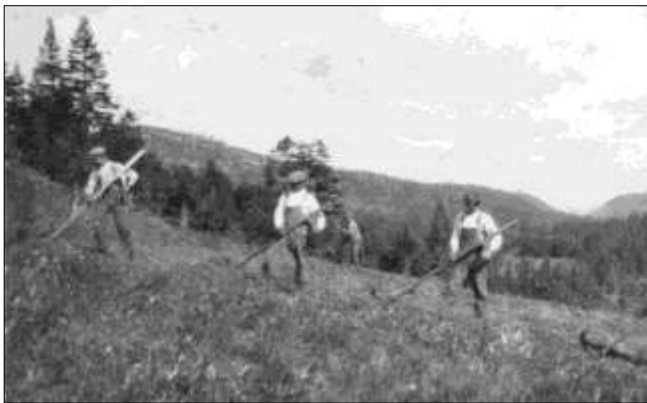
Slåttekarer i Hogsdalen (bildet er fra Øian)

Heldigvis har de fleste av oss opplevd hvordan graset ble til høy på låven i gamle dag. Går vi 100 år tilbake var ljaen redskapen for å få slått gras. En lja består av skaft av tre (orv) og et skjæreblad av jern. Ljaen måtte være kvass, så starten på økta var å kvesse ljaen på slipestein. Finslipingen gjennom dagen skjedde med bryne.