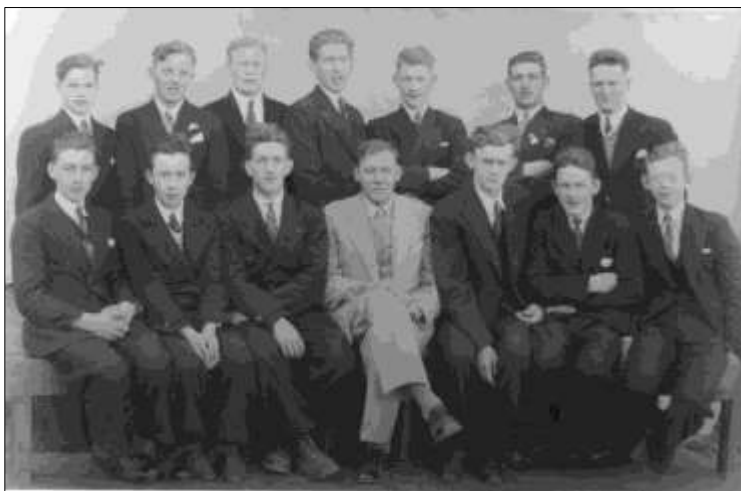
Snikkerkurset i Åsvang på Selnes i 1936.