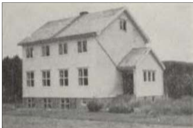
Skolen slik den så ut i 1955.