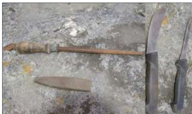
Slakterknivene, heina og kvessefila. Det var viktig at kniven var sylskarp!