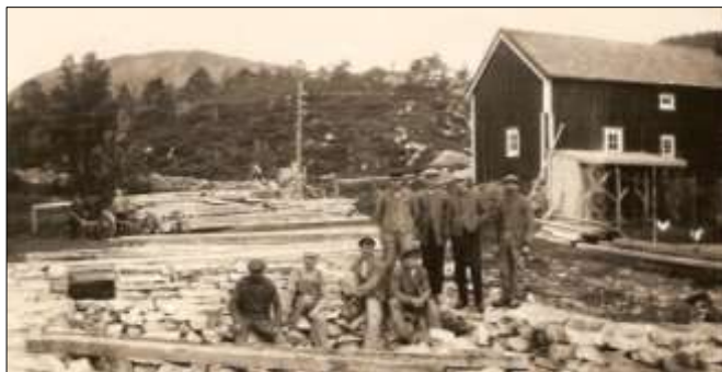
Grunnmuren til nyskolen mures i 1929. Det gamle fjøset ble senere revet.

store tomte så mye jord at Jon Bugge ved jordbruks-tellinga i 1918 hadde et areal på 0,4 mål havre, 0,3 mål poteter, 0,2 mål kål og 1,1 mål kunsteng og ei besetning på 1 ku og 15 høns. Fjøset vises på fotoet av grunnmuren, men det ble senere revet.