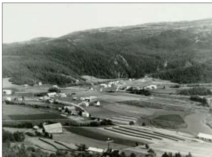
Hesjer på rekker og rad i Sørkjolen på 1950-tallet.

Derfor ble hesjing den vanligste måten. I Stjørna var det vanlig å sette staur på 2 meter med 2-2,5 meter avstand så langt som enga rakk. Så ble det trukket galvanisert jerntråd fra stolpe til stolpe. Tråden ble festet godt i begge ender, vanligvis på endepåler som var slått godt i bakken. Her var det viktig å være nøye, staurene måtte stå godt i bakken og tråden godt festet og passe høgt. Når ett lag gras var lagt på skulle neste tråd legges på passe høgt over. 3 til 4 tråder var vanlig.