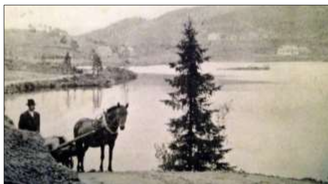
Skolen på Gjølga ca 1920 i bakgrunnen.

I eksamensprotokollen er Søtvik og Gjølga ført som parallelle kretsar fram til 1877.