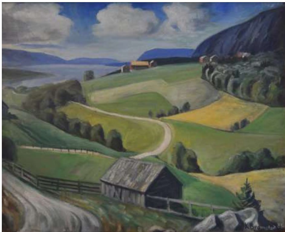
Maleri med motiv fra Sør fjorden 1938. Eier av Tor Stallvik.

Dersom noen har maleri eller tegninger etter Kåre Bromstad vil Stjørna heimbygds lag gjerne låne eller få kopier av dem. Vi er takknemlig for alle opplysninger. Ta gjerne kontakt via epostadresse; eilerbj@online.no