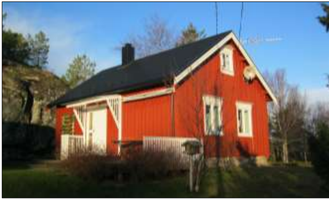
Skolebygningen står på øya i dag. Den er godt vedlikeholdt og brukes til fritidsbolig.