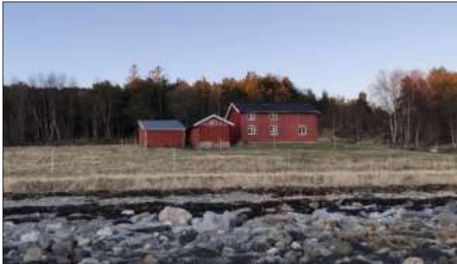
“Edvindstua”. Til venstre for husene sto møllesteinen ved en furu i sin tid. Foto: Johan W. Selnes, 2017.

Møllesteinen i myra, hvor kom den fra og hva den var brukt til. Det er gåten som det fortelles om i denne historien.