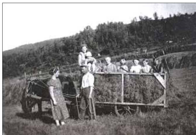
Innkjøring av høy på Råk med trækker i vogna.

Når høyet skulle i hus var det hest og vogn som var redskapen. Høyvogna var litt forskjellig etter distrikt. I Stjørna var det mest vanlig med 2-hjuls vogn med høge karmar. Skulle en få på stort lass måtte noen opp i vogna og tråkke. Ungene likte godt å få være med og sitte på lasset inn til låven. Her kom også traktoren og overtok. Påmontert høysvans ble det arbeidet effektivt og mye slit ble spart.