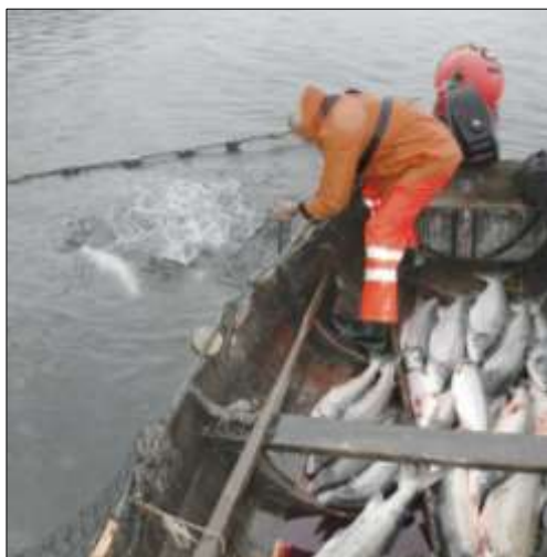
God fangst

For 50 år siden og tidligere var laksefiske i sjøen en betydelig del av inntekta for bruka så lå langs sjøen og hadde rett til fiske. Det var mange småbruk som skaffet mat og inntekt til de vanlig utgifter fra bruket. Skulle det investeres var et godt kilnotfiske som skaffet pengene. Laksefiske i sjøen er så godt som helt slutt nå.