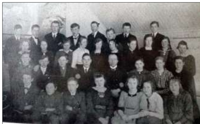
Amtskolen i Høybakken.

«Maandag den 25de jan. 1915 vart den nye skulen paa Fjellheim teken i bruk. Ingen av foreldri og ingen av tilsynsutvalget og ingen fraa skulestyret var tilstades – Læraren sa nokre ord til borni um den nye skulen og um skulearbeidet og eit par songar vart sunge. Dermed vart skulen teken i bruk. Interessen for skulen og arbeidet i skulen tykkjest ikkje staa i samhøve med, kva som er paaskosta i krinsen.»