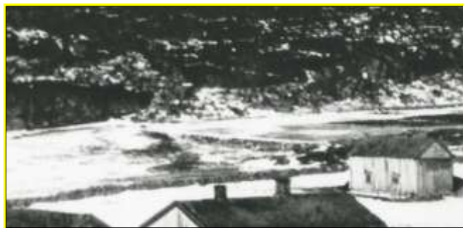
Gangstøa først i 1920-årene. Legg merke til raset.