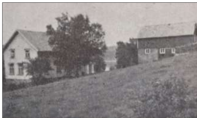
Selnes nye skole, Bjørklund.