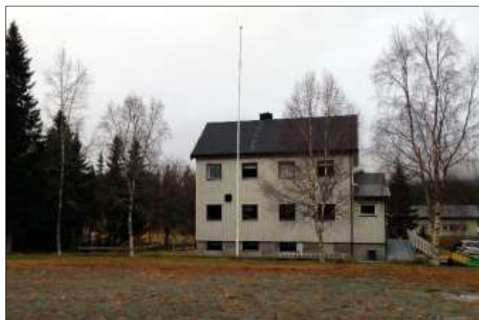
Skolen slik den er i dag.

Elevtalet varierte mellom 14 og 36. Skolen var todelt fram til 1961/62. Da vart skolen på Gjølja lagt ned og Solheim tredelt til 1965, da også det kapittelet vart avslutta. Da kjøpte grenda skolen til samlingshus. Fram til 1970 vart det halde gudsteneste her ein gong om året.