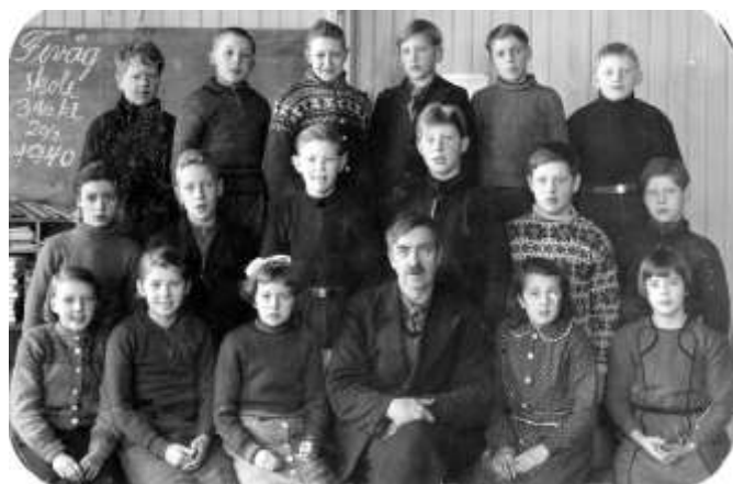
Fevåg skole 1940. Foto ukjent

Det var flere ganger skolestyret behandlet krav om utvidelse av arealet og bedre plass for husdyra. I 1910 ble det kjøpt til jord som skulle bortforpaktet til læreren mot at han skaffet brenntorv til skolen.