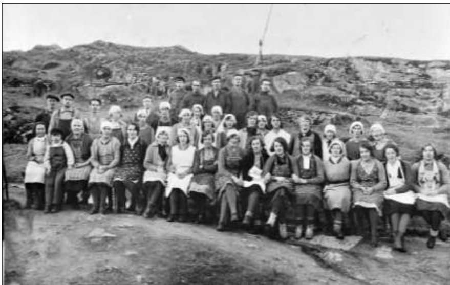
Arbeiderne på bergene overfor fabrikk.

Den største delen av produksjon gikk til Tyskland. Fabrikk ble lagt ned på grunn av dårlige vassforhold i Råkvåg, noe som skjedde først på 1930-tallet. Den ble flyttet til Saga, men brant ned i 1939. Den ble ikke gjenoppbygd.