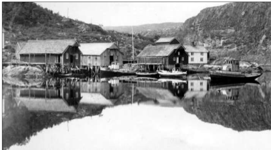
Monsvoll med bryggerekka ca 1942.

Det store sildeeventyret startet i Stjørnfjorden i siste halvdel av 1500-tallet. Sildeinnsiget av feitsild som tidligere var omkring Oslofjorden og Båhuslen, forandret seg. Det flyttet nordover kysten, blant annet til Trøndelag. Der ble Stjørnfjorden og Bjugn fjorden de mest kjente sildefjordene. Det var sikkert sild ute på kysten også, men en var avhengig av at fiske foregikk inne på fjordene. Den tiden fisket man fra små og åpne båter. Og for å fange silden i not, var en avhengig av at silden kom inn til land. Da var Nordfjorden med Indreråkvågen, Svartvika, og Kvernhusvik gunstige plasser for sildeinnsig. Likedan Nøstvika i Råkvåg.