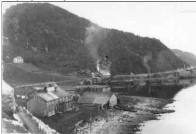
Røyken fra Saga fabrikk er vanddamp ved tørking av sildemel. Der kunne en også ha tørket fiskemel til mat.

Firmaet skal etter hva vi erfarer, ha tilbudt provianteringsdepartementet å stille oppfinnelsen og fabrikk til deres disposisjon. Det vil være ønskelig at man her i landet hadde sin oppmerksomhet henvendt også på fisken som næringsmiddel, ikke bare på mel. Vi nordmenn har ellers, som en politiker har sagt, en viss tilbøyelighet til å gå over havet etter mat.