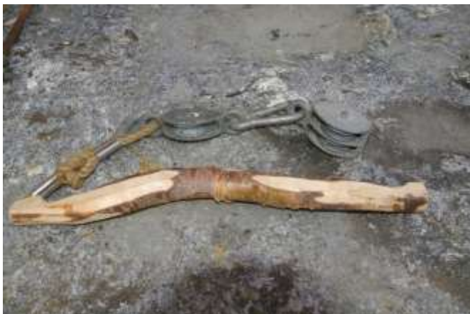
Disse redskapene ble brukt for å heise opp slaktet. Det skulle henge en tid før det ble partert.