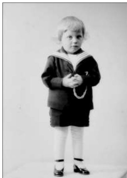
Gutt i matrosdress med ullstrømper