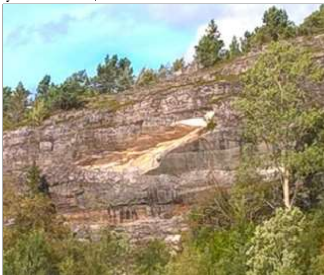
Herfra løsnet steinraset.