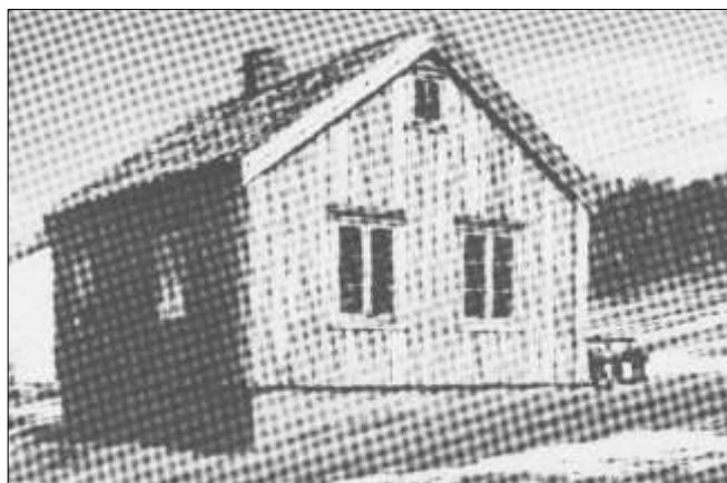
Skolestua etter at skolen var nedlagt.

Skolen var fra 1921 ikke i bruk, men i 1926 blusset striden opp igjen. Da det var for mange elever på Mælan og plass på Selnes, ville skolestyret at elevene fra Fessdal skulle gå på Selnes. Ingen elever møtte opp og oppsitterne i skrev brev der de nektet å sende barna til Selnes. Så igjen holdt skolestyret på sitt og ila bøter på 3 foreldre med 4 barn. Nå blandet skoledirektøren seg inn med en uttalelse om at sammenslåingen av de to kretsene ikke var lovlig behandlet da det hadde foregått på et felles kretsmøte. Skolestyret holdt på sitt og ville ha en uttalelse fra departementet, skulle den støtte skoledirektøren så måtte de gjenåpne skolen i Fessdalen. På neste møte forelå uttalelsene som mente at kretssamlingen ikke var rett foretatt. Flertallet i skolestyret ville ikke gi seg og ville innhente opplysninger fra de som deltok på det felles kretsmøte. Forslag om å åpne skolen fikk 1 stemme. 10 mot.