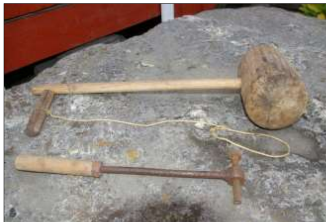
Dette var redskapene som måtte til for å ta livet av grisen. Taulokka som holdt grisen, piggen som ble plassert på rett sted og klubba for å slå med. Det ideelle var at det var tre mann på denne jobben, da hadde de bedre kontroll og at alt da skjedde momentant uten mislykkede forsøk