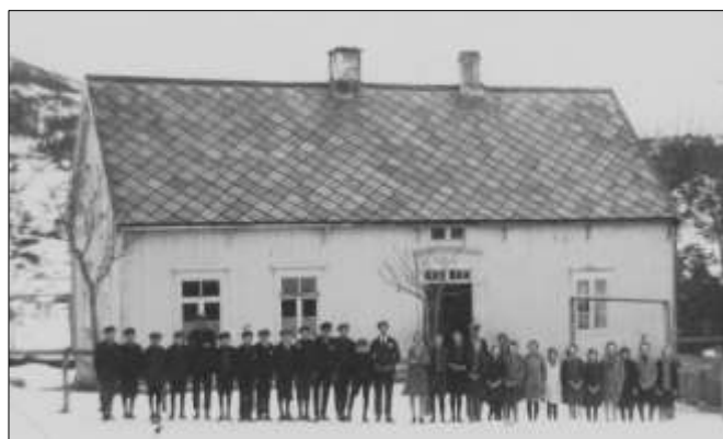
Råk skole ca 1925 med elever og A. og M. Bjørsvik.

I Albert Bjørsviks lærertid ble nyskolen på Fagerbakken bygd. Allerede i 1920 ble det krevd at skolen måtte utvides med en klasse til 4 klasser, og det ble lagt fram plan om å bygge ny lærerbolig og ombygge skolehuset slik at det ble 2 klasserom. Saken ble utsatt i påvente av mer utredning, men det skulle bli 4 klasser fra høsten dersom man fikk leie klasserom og skaffet lærerkrefter. Det kunne ikke skaffes passende lokale til en fjerde klasse, så det skulle fortsatt være 3 klasser. Det var ikke bare ny skole som behøvdes. Fjøset måtte også settes i brukbar stand, hevdet Bjørsvik i 1921, og en komité som besto av Bjørsvik, A O Indreråk, Lars Bromstad og Martin J Sørheim skulle utrede reparasjon eller flytting, men det ble bare nødvendig reparasjon.. I 1925 ble det konstatert at fram til 1932 ville det bli 90-100 elever ved skolen. Det kunne opprettes en småskolepost på 12 uker med ei hjelpe-ærerinne inntil videre, men en annen løsning var å sende elever fra Nedre Juvika, Ramsvika og Kleiva til Mælan skole. Denne løsningen var lite vellykket, for 4 av elevene møtte verken på Mælan eller Råk skole. Det var flytta inn flere barn til Mælan krets, så reguleringa ble vanskelig å gjennomføre.