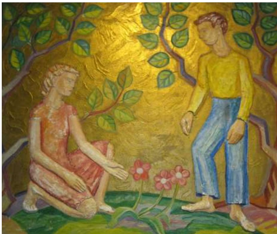
Et av veggrelieffene med bladgull, Foto Maria Husby Gjølga.