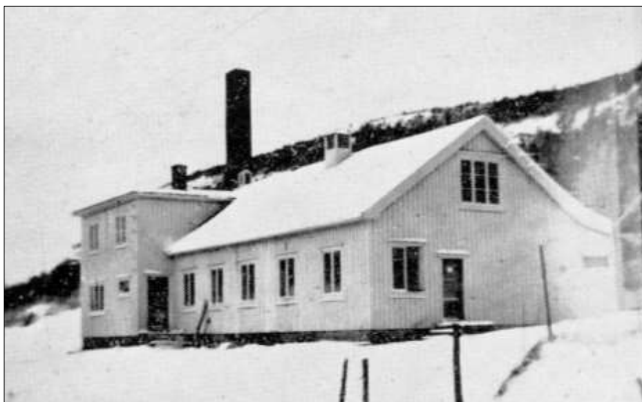
Sørffjord meieri på 1950-tallet

Det var kvinner som hadde ansvaret for å få laget smør av melka og ved Sørffjord Meieri var det en rekke meiersker i årenes løp. De hadde utdannelse fra meieriskoler; en av landets første skoler var på Reins kloster og senere ble det meieriskole ved Brekstad meieri. De som kom til Sørffjorden var unge damer og de ble attraktive koneemner. Derfor skal vi omtale dem som ble gift her i første rekke da de fikk stor slekt etter seg i bygda.