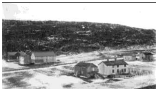
Her ser vi hvor steinraset gikk.

- Vi kan også se en "snarvei", som går fra Gangstøveien og til eiendommen "Øvre". Dette er sannsynligvis restene av den opprinnelige veien til denne eiendommen før eiendommen "Nedre" kom.