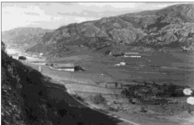
Vi ser torvmyra nederst til høyre og torvbuene.