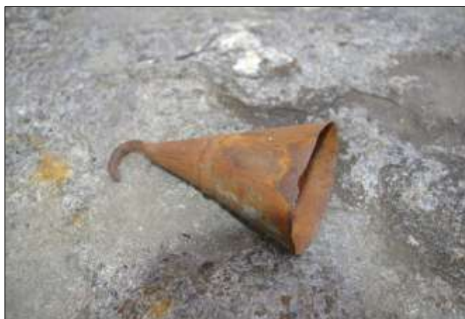
Bustskrape for å få av busta og med krok for å renske klauvene. Det ble brukt vann inntil 75 grader for da løsna busta lettere.