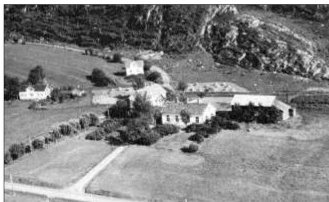
Skolen slik den var på 1950-tallet.