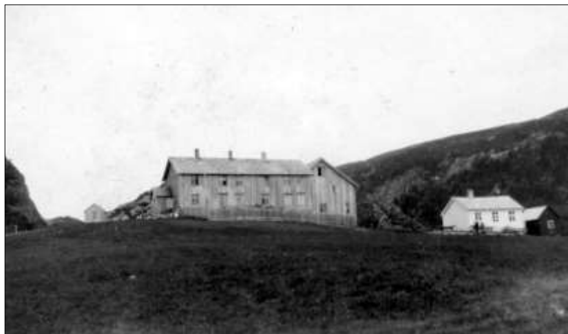
Skolen med gammelstue i Rødsjøen på 1930-tallet

Elevene til skolen var først og fremst fra Rødsjøgrenda, men det kom også elever fra Holvatnet, Agnetlia (i Rissa) og Lysvatnet (i Åfjord). Da det ble bosetting i Nordsetra kom barna derfra til Rødsjø og en elev kom fra Øyan. Ved folketellinga i 1875 var det 71 personer som bodde i området, derav 30 barn under 15 år. I 1900 var folketallet 67, derav 20 barn. I 1937 var elevtallet på skolen 9. For elevene som bodde i Rødsjøen mens de gikk på skolen fikk foreldrene støtte til dekning av mat og losji.