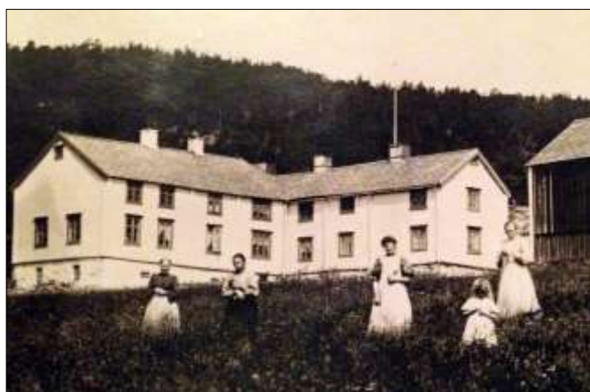
Innerlåna Søtвика med hvor det var skole i flere generasjoner

Det er ingen munnlege overleveringar om at det vart halde skole på Stallvik-valdet. Ingen av dei tre stualånene på valdet var særleg store. Året etter, 1864, er elevtalet og «adressene» det same, pluss at ein elev frå Hoøya også gjekk det året. I 1866 var 44 elevar registrerte.