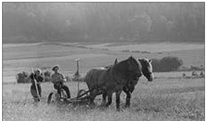
Slåmaskina letta arbeidet og ble populær

På slutten av 1800-tallet kom de første slåmaskinene for hest til Norge. Ei knivstang med mange trekanta blad lå i ei kamplate. Knivstanga beveget seg ved hjelp av hjula på maskina. Best var det å slå med to hester for maskina var tung å dra.