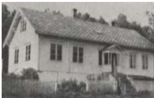
Gjølga Skole 1955.