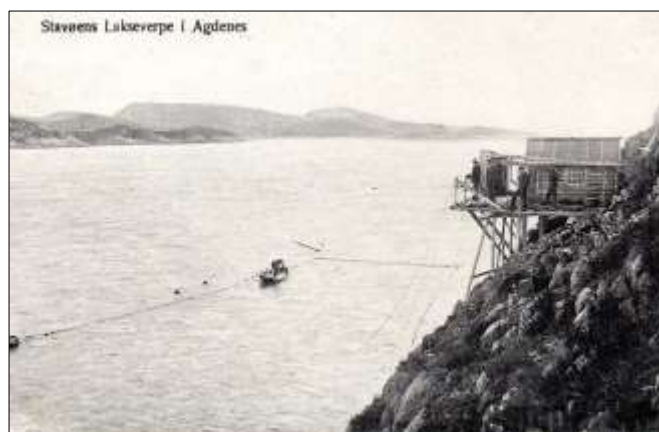
Stavøyvorpa i Agdenes viser hvordan ei vorpe ble drevet. Fra prospektkortet «Stavøens Laksevorpe i Agdenes».