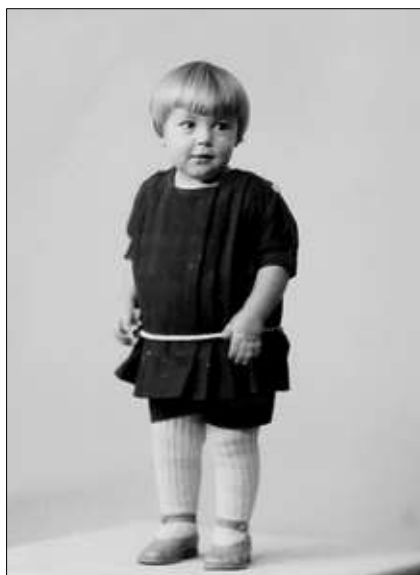
Jente i finstas med solide ullstrømper

Deretter kom skjorte og genser på. Til slutt heimestrikka lue og vottar, for ikkje å gløyme vedmålsbuksa. Tjukk og varm og god var ho. Men du verda så tung ho vart til kvelds, fullstappa av store snøklankar, som først forsvann etter en hardhendt omgang med sopelimen ute på trappa. Sjølv om påkledninga var omstendeleg, kan eg aldri minnast at eg fraus. Vi leid inga naud. Men du verda så glad og stolt eg var første gongen eg kjende den mjuke stillongsen mot bar hud. Sidan har eg aldri sakna «livet».