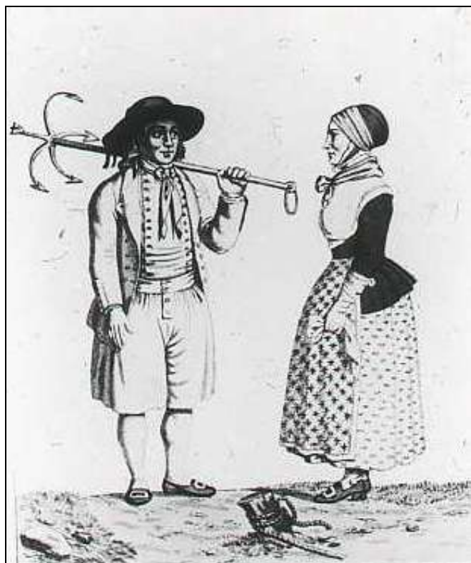
Mand fra Stjoren med sin Kone