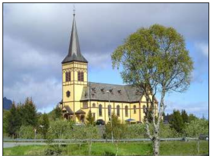
Vågan kirke i Kabelvåg