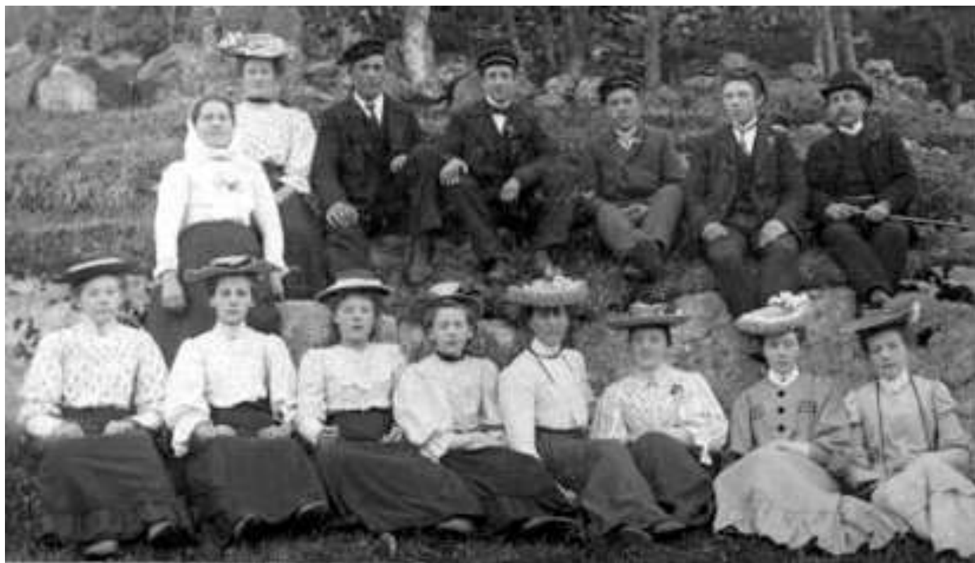
Indre Stjørna sangkor ca 1910

At det var ”Sølvkamma” som sto bak dette, ja det var det noe som alle trodde.