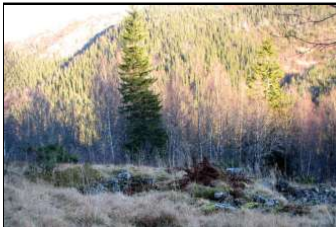
Rester av bustufta