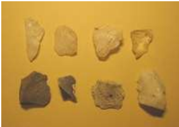
Avslag av kvarts, kvartsitt og flint fra Djupskarmoen

Sporene etter steinaldermenneskene ble oppdaget i 1995, etter at det hadde vært grøftet i området. Boplassene på Djupskarmoen lå noen meter over strandkanten da de var i bruk. Den gang stod havet 30-40 m høyere enn i dag og Fevåghalvøya var ei øy.