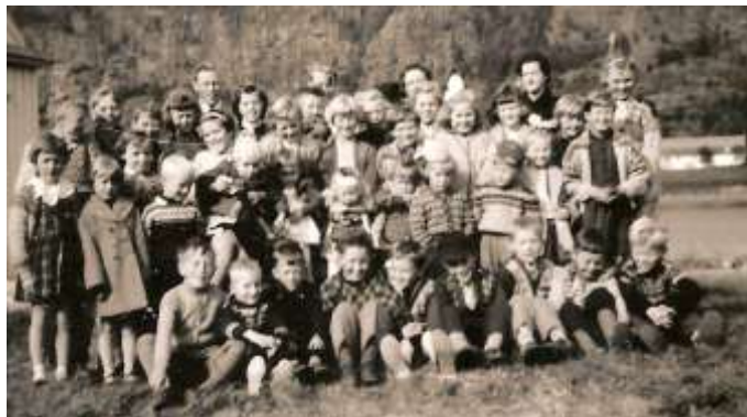
Søndagsskole på Husby bedehus