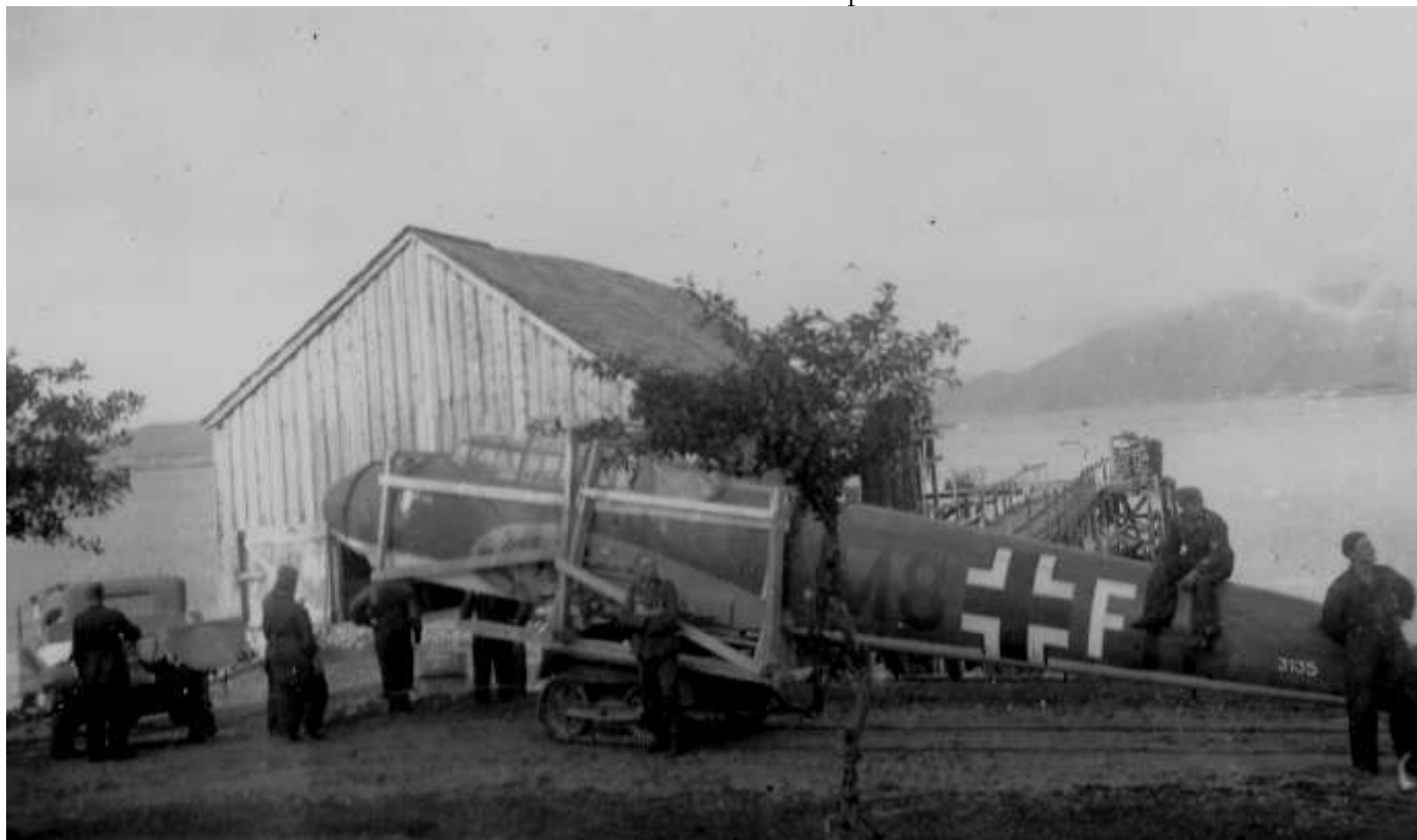
Dornier 17Z bombefly klar for utskipning fra kaia på Refsneshagen 5. august 1940.