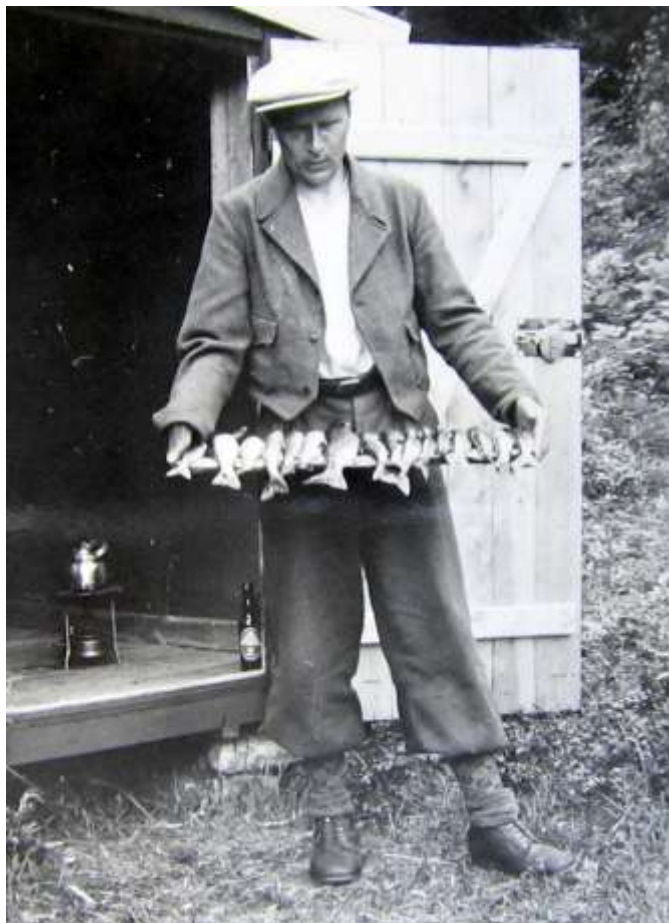
Stallvik med "sjølgjort" ørret

sure miner for det. Stallvik ymter om at han ved tid og leilighet vil gjøre et nytt forsøk.