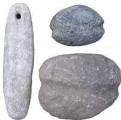
Fiskesøkker funnet i jorda ved Salbubekken

Salbubekk skal slik være en sammenskriving av sal og bu – salbu – som var den bua hvor hestene var plassert. Navnet kan også være et minne om saltbuer for salting av sild, som ble satt opp i forbindelse med de store sildefiskeriene i Stjørnfjorden på 1600-tallet.