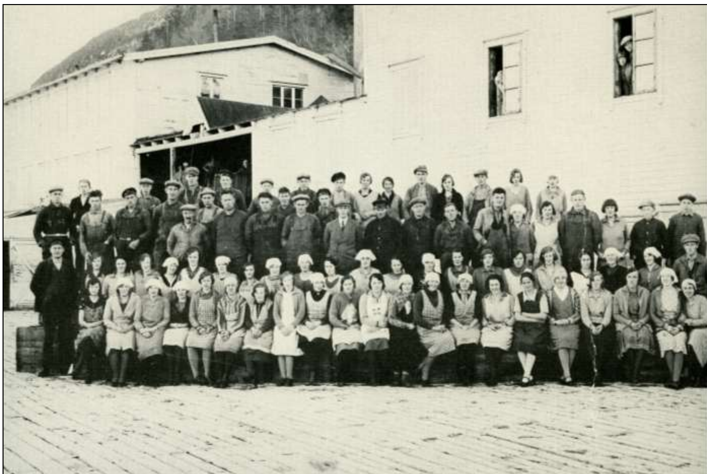
I årsheftet for 2010 hadde vi en artikkel om Saga fabrikk. Her er et flott bilde som er tatt omkring 1930 av de som arbeidet ved hermetikkfabrikken som brant ned 3. mai 1939.

Korleis det elles kunne sjå ut, vart det alltid ei råd med hus og mat når ein sliten vandringsmann var nådd fram til Nordsætra. Det var å ønske at eigenskapar som denne ikkje måtte gå tapt, sjølv om det ikkje kann vera til å unngå at den nye veggen, og "sivilisasjonen" som følgjer med den, kjem til å snu opp ned på mangt i livet deira.