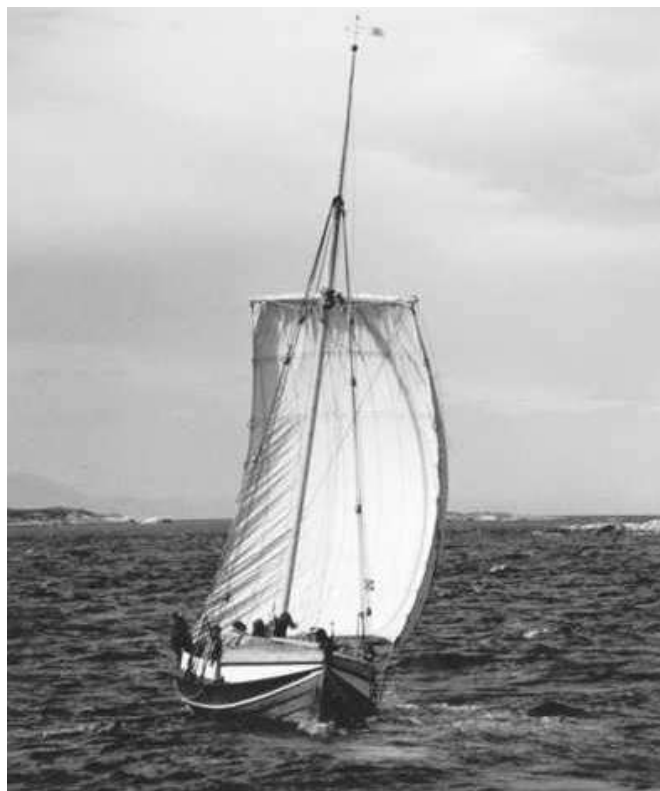
Det var trolig en slik båt som de segla med