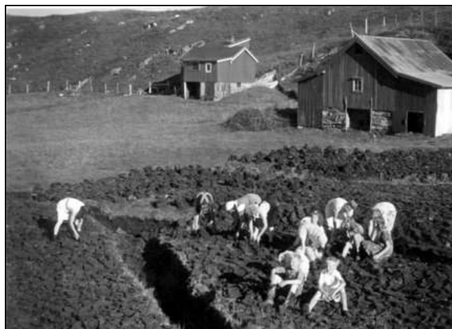
Torvtaking på Keipen på Selnes

Da den elektriske komfyr kom på kjøkkenet ble det umoderne med torv som brensel. Alt skulle være lett og reint. Utover 50 tallet ble det derfor slutt på torvtaking og nå er det bare gamle torvdammer og torvbuer til nedfalls, som minner oss om torvtakinga.