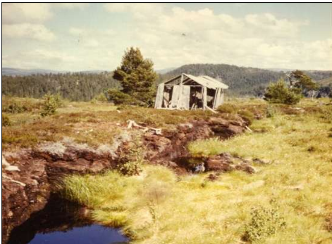
Torvbu og torvdam på Aunfjellet