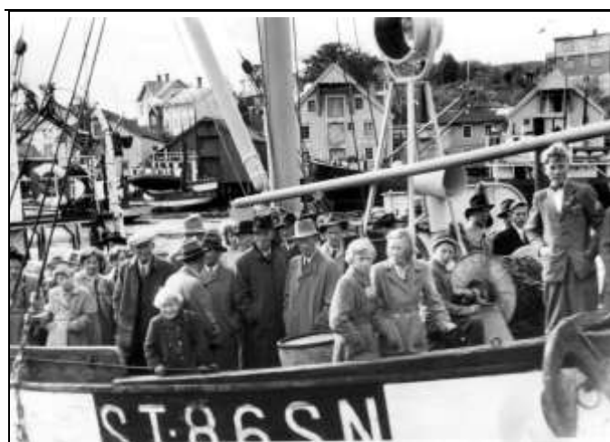
Besøk om bord på nypusset båt

Jeg må tilføye at det ble et godt landnotfiske i Stjørna denne sommeren, og føringsbåter med sildlast gikk nærmest i rute ut fjorden. De fleste gjorde gode lotter på silda dette året.