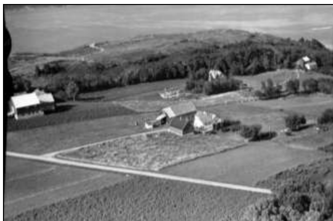
Frengen med Stavneset

Denne delen av historia er hentet fra Frøyaboka av Maurits Fuglsøy.