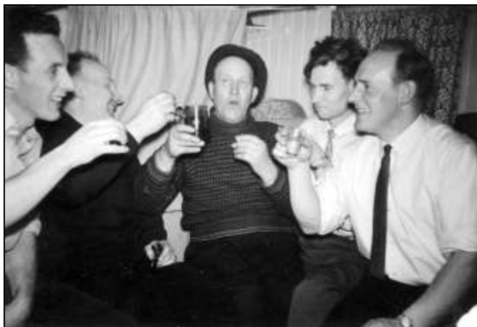
Lystig lag i lugaren på "Fjell"