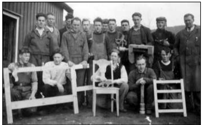
Snekkerkurs på Varden i Råkvåg Stolte deltakere med flotte ting de har laget