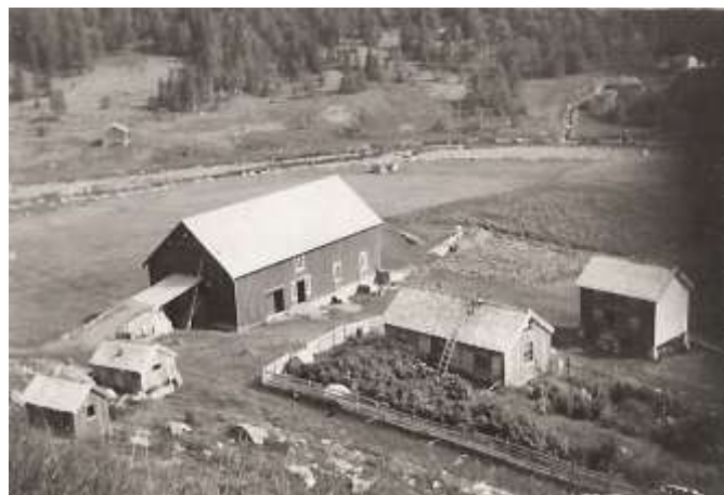
Nordsætergården i 1939

fiskerike vatnet følger på det andre med blange elvetrådar imellom.