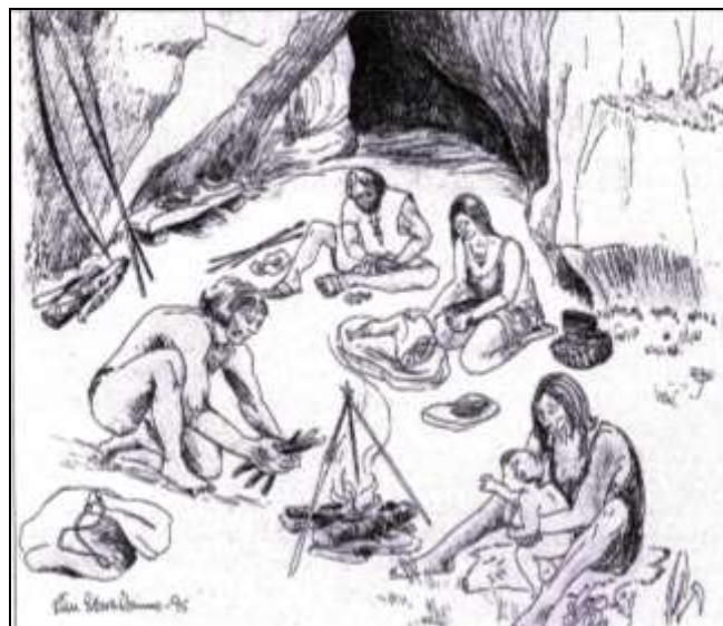
Livet utenfor hulen en varm sommerdag

Blant dyrebeina ble det påvist bein både av okse, sau og geit. Av særlig interesse for øvrig er at det fantes et par bein av geirfuglen (det er en utdødd alkefugl som ikke kunne fly, den ble opptil 70 cm).