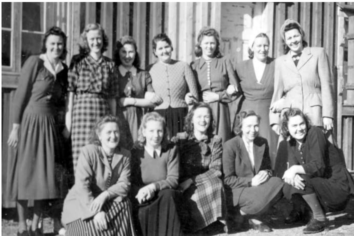
Sykurs i Varden