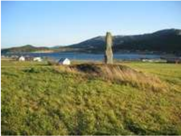
Bautastein på Finnkaribaugen

På Finnkarihaugen står en bautastein fra jernalderen. Et sagn forteller imidlertid at bautaen ble reist til minne om ei finnkjerring som ble slått i hjel her.