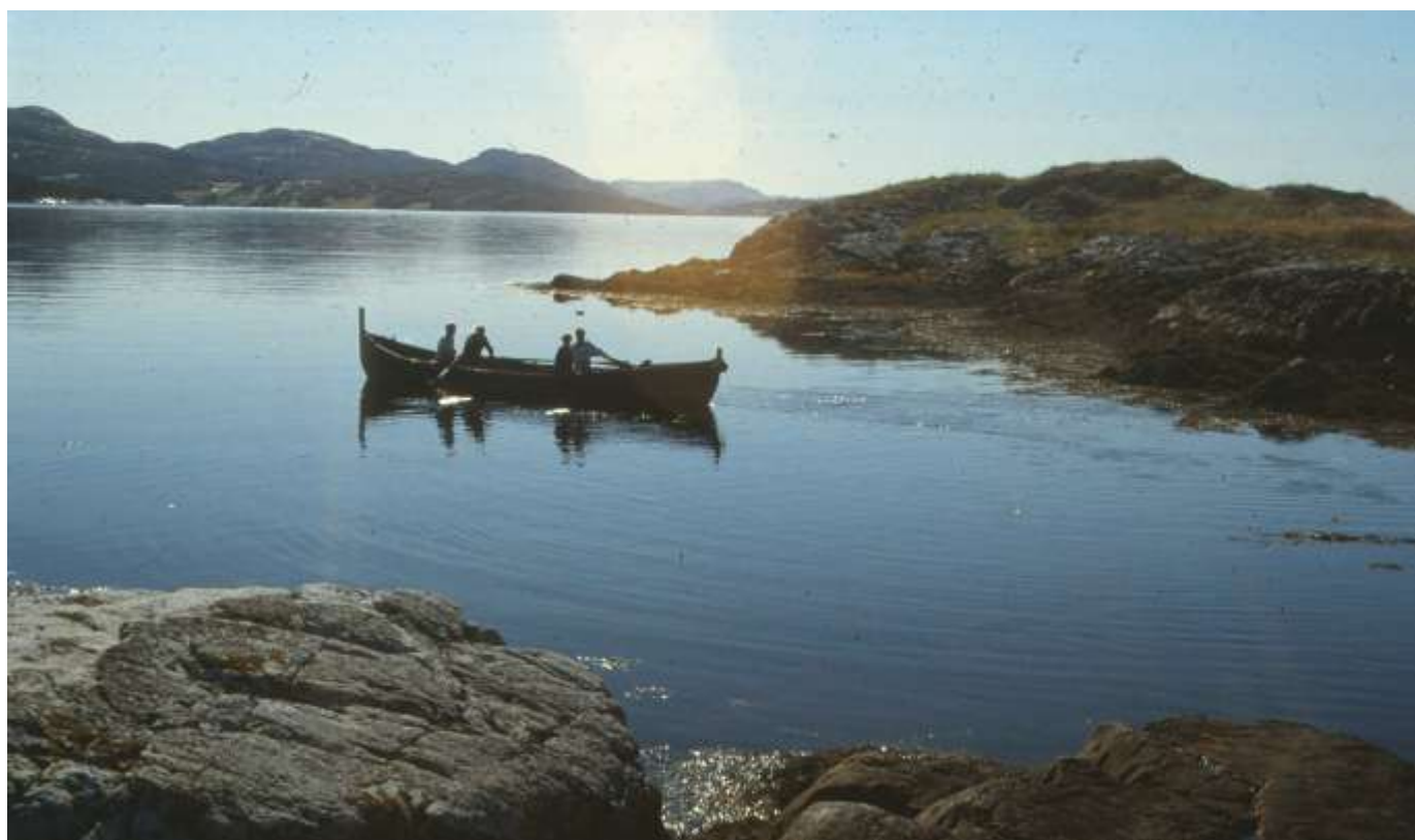
Færing på den blikkstilte Stjørnfjorden