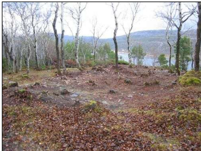
De tre hustuftene på neset, Refsnes. Tufta lengst vest nærmest. De avdekkede hustuftene vises som tre tydelige skålformede fordypninger i bakken. De er ikke lette å se på bildet, men når en står ved siden av disse på bakken vises de tydelig. Sjøen har gått opp til venstre kant av bildet.

Vi dro ut sammen og kikket på stedet. Det var ingen tvil: Her lå det fire sikre og ei noe mer usikker tuft av samme slag som de som tidligere var funnet. De var runde til ovale med en diameter på rundt fem meter.