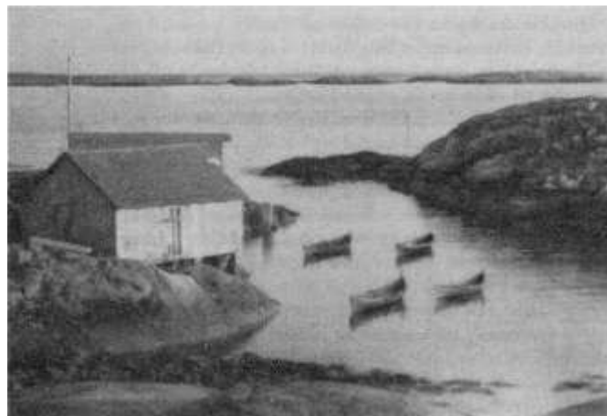
Bilde fra Gjessingen

Det var godt vær om dagen, det så også ut for at det skulle bli godt vær, og ingen tanke var vel denne huslyd fjernare enn at dei som reiste skulle bli borte for alltid.