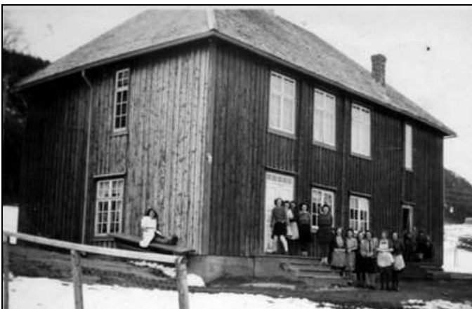
Sykursdeltakere foran det nye Fritun ungdomshus Her var det stor aktivitet med kjøkken og saler i 1. etasje og kommunale kontorer i 2. etasje