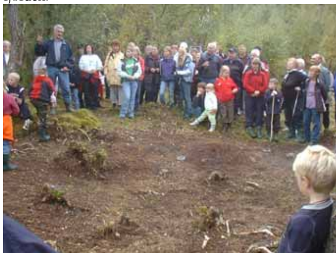
Ved bautaen er også rester av meget gammel bosetting

Plasseringen er ikke valgt tilfeldig, for dette har vært en samleplass for folk både fra Sørfjorden, Frengen og Fevåg fra gammel tid. Dessuten vises den godt fra sjøen, der hvor hovedtrafikken foregikk i den tid bautaen ble reist, og også fra den nyanlagte veien på sørsiden av fjorden.