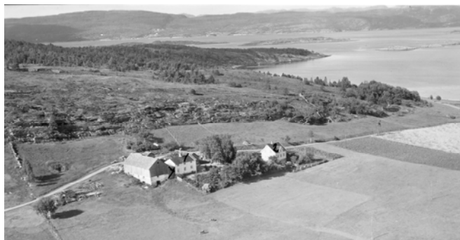
Selnes med Refsnesåsen i bakgrunn