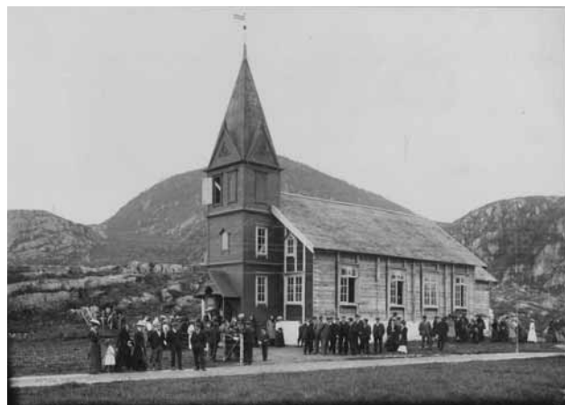
Kirka vid innvielsen i 1909