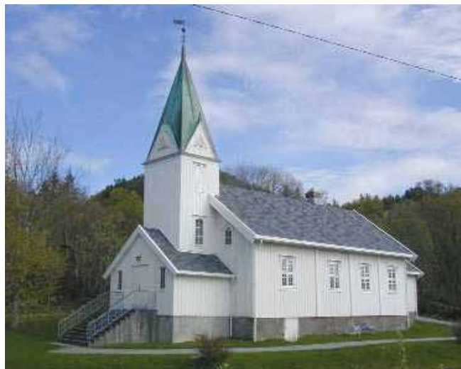
Ramsvik kirke i dag