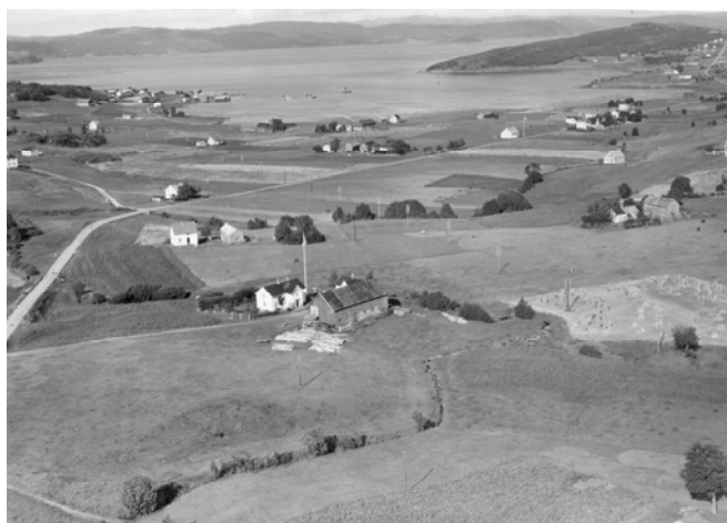
Fevåg med Fevågbukta

med til dette godset. For å finansiere kjøpet lånte Kristoffer Foss 1000 riksdaler av generalveimester N F Krogh i Trondheim.