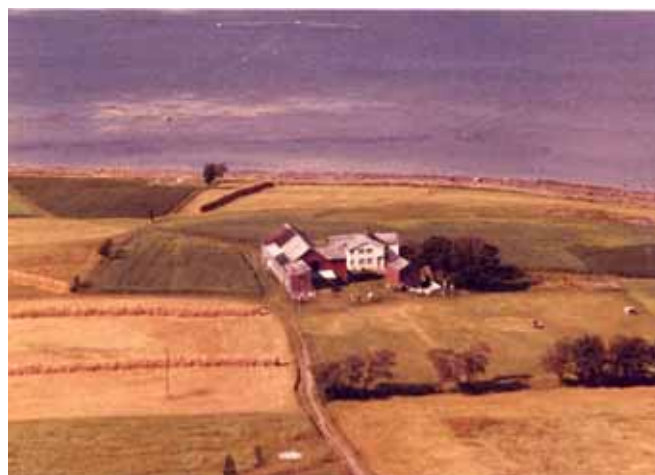
Fevåg gnr. 140, bnr. 1 i 1960

I oversikten over eiendommer i Stjørna fra ca 1505 savner vi opplysninger om flere antatte mellomaldergårder, som Gjølja, Duskardet, Røsjøen, Haugsdalen, Tännårvika, Kvernhusdalen og Hafella. Vi har sett at Gjølja sorterte direkte under Austrått i 1661, og det kan også ha vært tilfellet først på 1500-tallet. De andre gårdene vi savner opplysninger om, kan også ha vært Austråttgods. Det ville være rimelig at Austrått hadde en del jordegods i Stjørna allerede før makeskiftet i 1505.