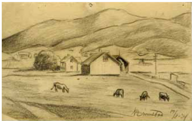
Meieriet i Sørkjolen Tegning av Kåre Bromstad