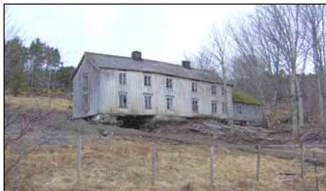
Gammelstua på Refsneshagen under restaurering

helhetlig og sammensatt kulturmiljø, viser også arbeidet på Refsnes bredden i kulturminnearbeidet i fylket vårt, både på nyere og eldre tid. I området ved den gamle dampskipskaia er det nå aktuelt å restaurere gammelstua, Refsneshagen, og bruke den sammen med flere nybygg som utleiehus for fisketurister. Det er et omfattende arbeid som må gjøres for å få bygningen klar til å ta i mot gjester, men samtidig er bygningen et lovende eksempel på at ivaretagelse av gamle bygninger også kan være næringsutvikling. Restaureringen av gammelstua på Refsneshagen samler hensynet mellom vekst og vern og viser hvordan bruk og vern kan gå hånd i hånd slik at det som ble skapt for lenge siden og det som skapes i dag kan bli verdifulle elementer i kulturmiljøet også i framtiden.