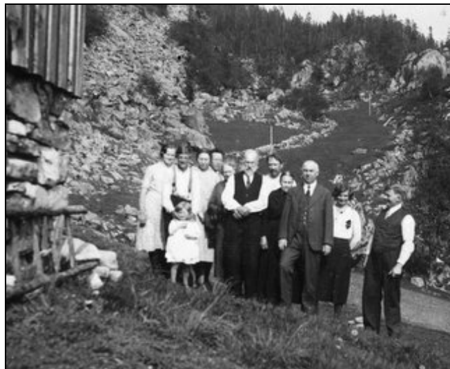
Folket i Petersvika er søndagskledd

god, og da mor vart átvara mot arbeidet, svara ho at ho hadde lært meg å ta vare på meg sjølv.