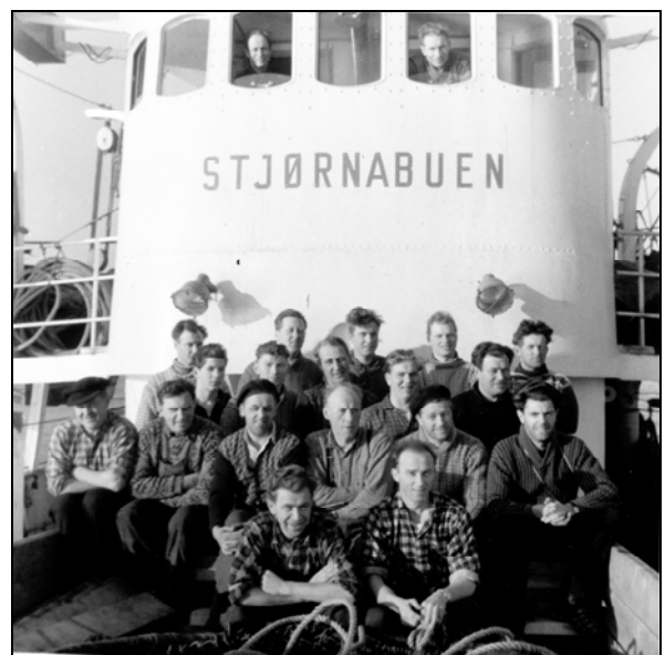
Stjørnabuen med mannskap. Sjefen sjølv i styrhuset