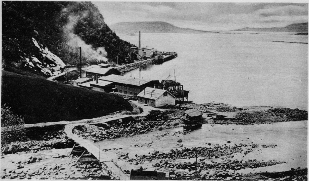
The North, Atlantik Canning Co A/S