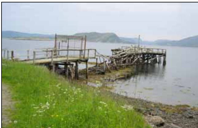
Kaia før restaureringen