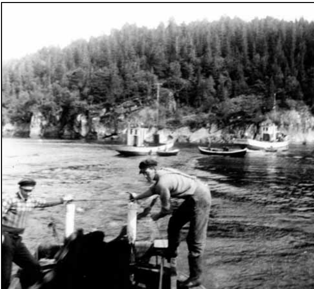
Landnotsteng i Nordfjorden

Om vågakarane tar seg den friheta og kjører ut nota, blir det anna lât i storbasen. Da finn han på alt mulig som kan hindre notlaget frå Vågen i å få nota mot land slik at dei kan sjå om det er noko i ho.