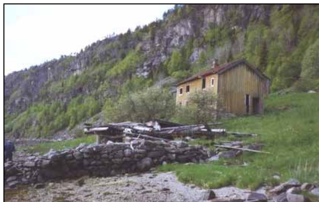
Stua i Petersvika i 1999 før den ble revet