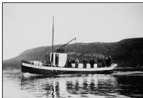
Notbåten på vei ut

Dunk - dunk - dunk kjem det frå Notmann på Vågen og svarte ringar av røyk går opp i lufta. På land står vi smågutane og ser på røyken og undrar oss over kor fine røykringar som kjem opp frå skorsteinen på Notmann.