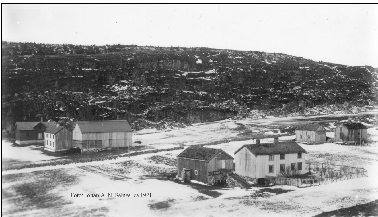
Gangstøa på Selnes omkring 1921