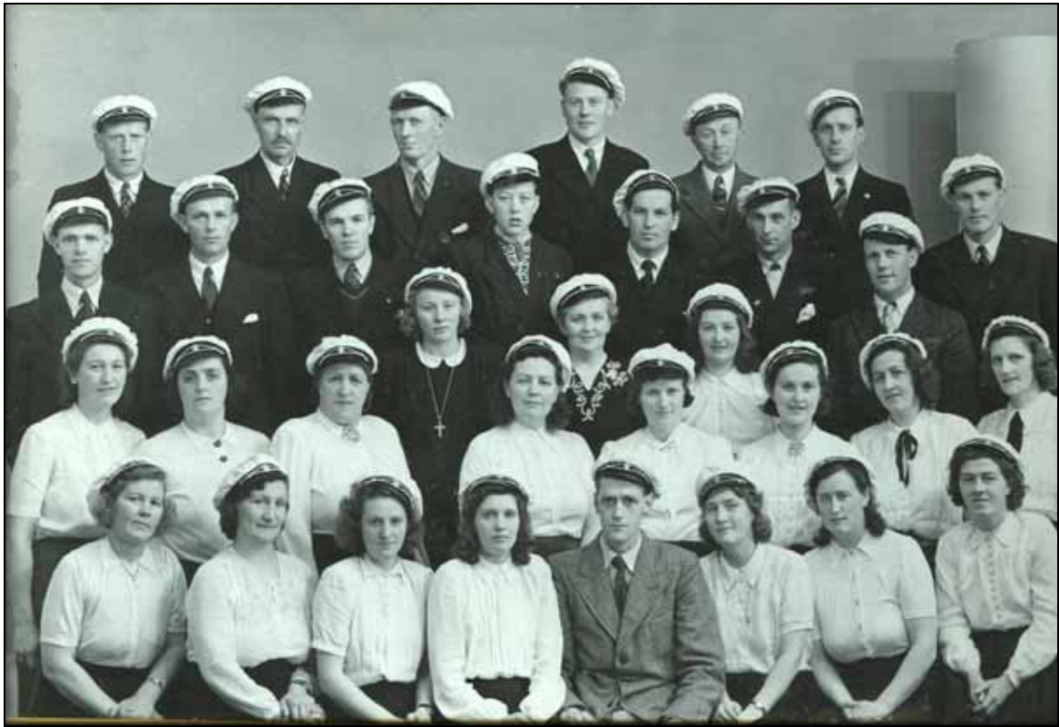
Bilde av Indre Stjørna Songlag fra 1949